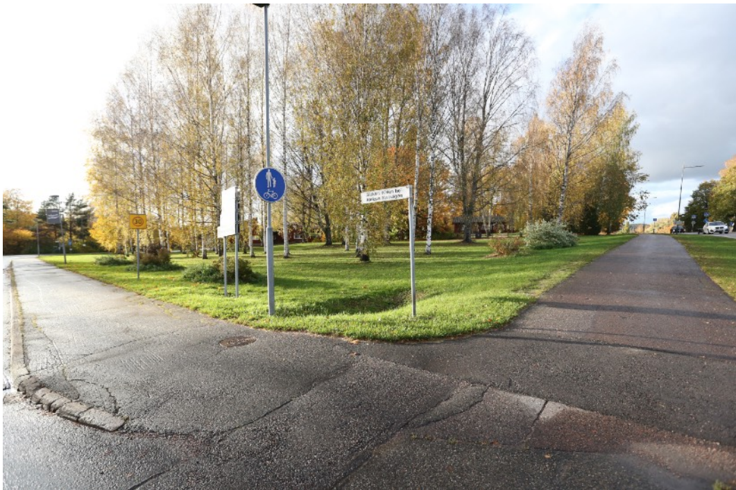
Fanjunkars / Bruses