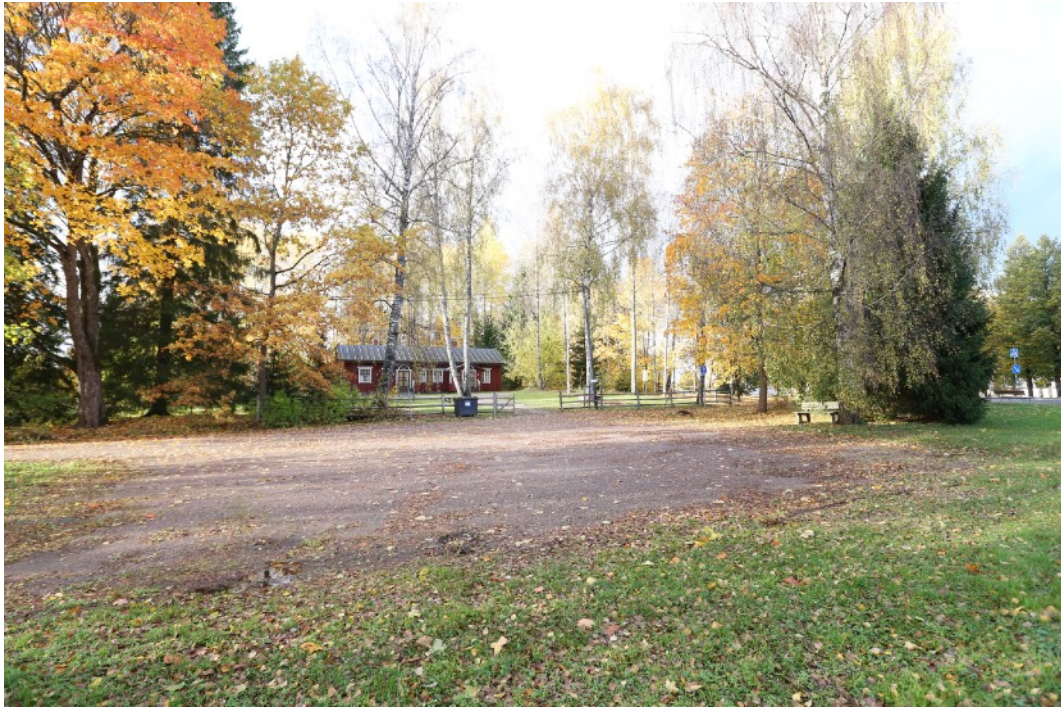
Fanjunkars / Bruses