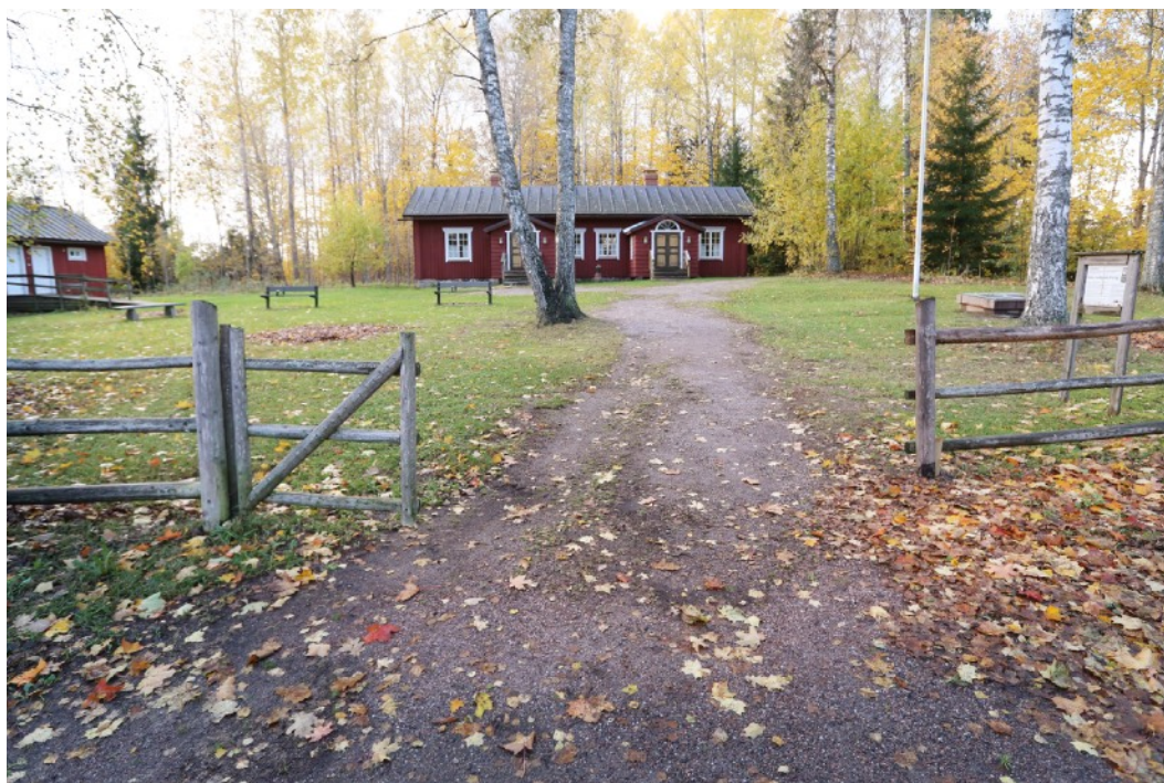
Fanjunkars / Bruses